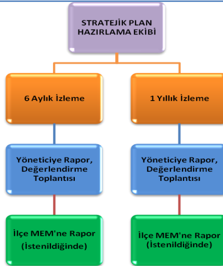
İzleme ve Değerlendirme Takvimi