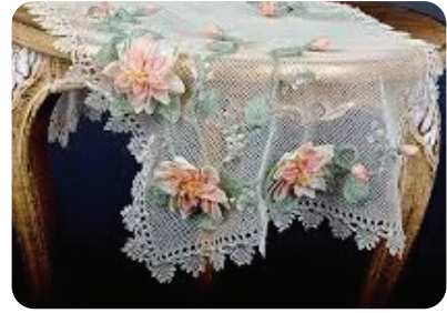
İğne Oyası Motifi

Dolaylı iletişim insanların iletişimde tercih ettiği yöntemlerden biridir. Günümüz insanı nasıl duygu ve düşüncelerini telefonlarındaki sembollerle ifade ediyorsa, Anadolu insanı da konuşmak yerine kendilerini renklerle, motiflerle ifade etmeyi tercih etmiştir. Bu yöntemlerden birisi de dünyada "Türk Danteli" olarak tanınan iğne oyasının motifleridir. Anadolu kadını oyalarla sadece başörtüsünü süslemez, onları âdeta birer sözsüz iletişim unsuru olarak kullanır. İğne oyasıyla sevgi, acı, pişmanlık, öfke, düş kırıklığı, mutluluk gibi duygularını dile getirir.